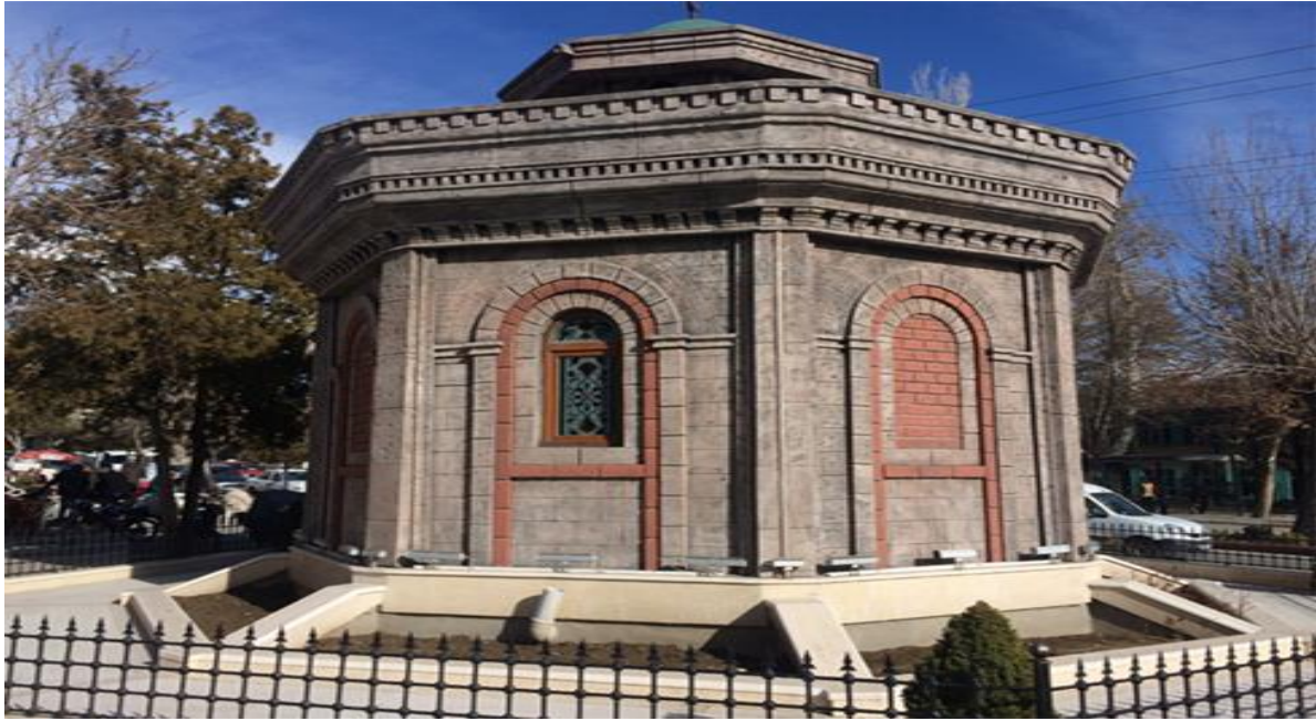
Görsel 3: Ahmed Kuddusi Makam Türbesi restorasyon sonrası