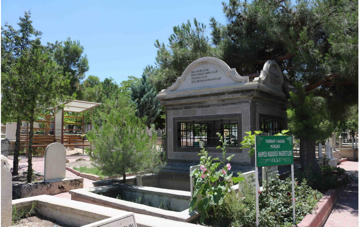
Görsel 1: Ahmed Kuddusi Mezar Anıtı