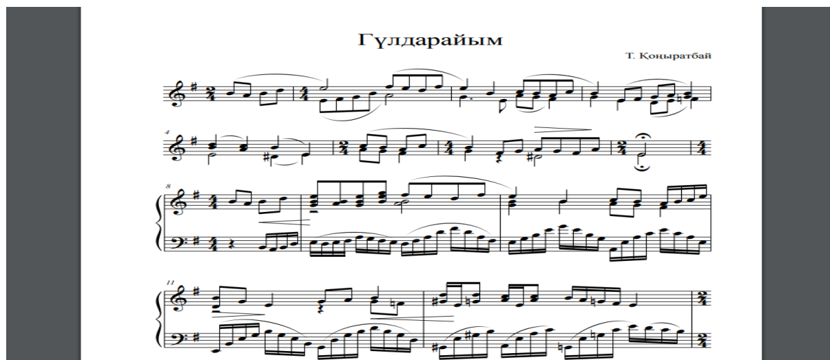
Сурет 3: «Финал» бағдарламасымен терілген «Гүлдарайым» шығармасының партитурасы

Ізденуші Д.Мырзаханованың жұмысының мазмұнында көрсетілгендей, «Final» ноталық музыкалық бағдарламасының мүмкіндіктері мен оны меңгеру тиімділіктері мынадан байқалады: