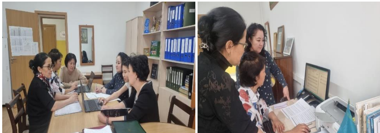
Сурет 1: «Final» бағдарламасымен жоба мүшелерінің жұмыс барысы

Жалпы, заманауи бағдарлама ретінде «Final» музыкалық бағдарламасы ноталықстанда тікелей жұмыс жасауда, дайын музыкалық материалды тындап, өңдеуде, редакторлауда тиімділігі зор деп атай аламыз. Осы бағдарлама арқылы болашақ музыка мамандары хорға, оркестрге, жеке орындаушыларға, ансамбльдерге арналған партитураларды теріп, оқу үдерісінде пайдалана алады, жас жеткіншектердің музыкалық сауаттылығын, есту қабілетін, орындаушылық мүмкіндіктерін реттей, әрі дамыта алады. Сәйкесінше, бағдарламаны қолданушы енгізіп отырған ноталық жазбаға лайықты музыкалық аспаптың тембрі мен дыбыстық бояуын сақтап, өңдеулер жасай алады, және оның ұтымды нұсқасын таңдап сақтай алады.