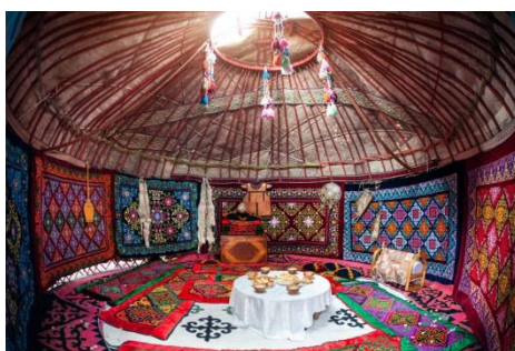
Сурет 2: Киіз үйдің ішкі көрінісі

Киіз үйдің өлшемдері адамның масштабына оңтайлы сәйкес келеді, ішкі орналасуы оның тұрғындарының қызығушылықтары мен талғамдарын ескерді және дала жағдайында үй шаруашылығының ең қолайлы жұмысын қамтамасыз етеді. Киіз үй қажетті материалдар белгілі бір аймақта үй салу кезінде ескеру қажет маңызды фактор болып табылады. Бір қарағанда, дала тұрғындарының көпшілігі үшін киіз үйлер уақытша баспана болып көрінгенімен, бұл үйлер Азиядағы көшпелі тайпалар мен халықтардың тұрақты мекені болған. Осы себепті құрылысқа арналған материалдар мүмкіндігінше ауа райына төзімді, берік және экологиялық таза болып таңдалды.