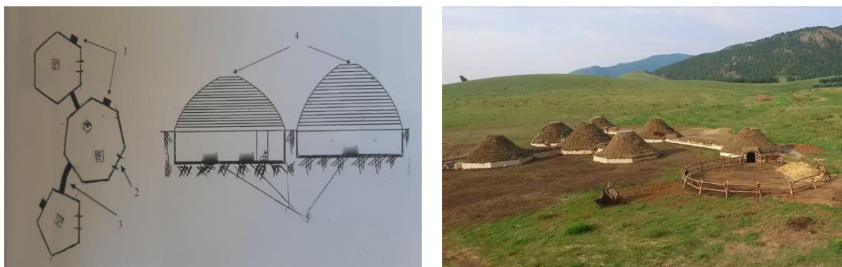
Сурет 1: а) Ботай мәдениетіндегі тұрғын үйлер сызбасы; ә) Ботай мәдениеті көрінісі

Сәулет өнерінің жинамалы және жылжымалы үлгісі саналатын киіз үйдің бойынан халқымыздың рухани әлемі, ұлттық болмысы, дүниетанымы, эстетикалық талғамы орын алған.