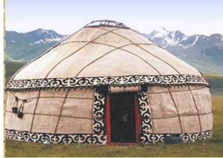
Сурет 3: Қазақ киіз үйі

Киіз, ақ үйлердің түрлері мен атаулары да көп. Бұларды, ақ ала орда, ақ орда, ақ шаңқан, алтын орда, алтын үзік деп атаған. Ал орташа шаруа мен кедей шаруаларға тән киіз үйлерді алты қанат, ақ үй, боз үй, қоңыр үй, қара үй, қара лашық, қалмақ үй, лашық аран, жаба салма, көтерме туырлықты, кепе, ұранқай, күрке, қамсау, (шошала) отау, итарқа, жаппа деп атаған. Кішігірім қақыра немесе қалқа сияқты үйлер көбінесе соғыста майдан шебіндегі далада, кейде қорған есебінде тігілетін болған. Қазақ киіз үйлерінің негізінен екі түрі болған: «қыпшақ үлгісі», «қалмақ үлгісі». «Қыпшақ үлгісіндегі киіз үйдің иығы шығынқы, мінсіз дөңгелек болса, қалмақ үлгісі шаңырақсыз, еңсесіз шошақ үй. Ертеде Дах массагеттерде шошақ, не жартылай сфералық түрдегі, ағаш пен киізден тігілетін күрке немесе киіз үй сияқты алып жүруге ыңғайлы жиналмалы тұрғын үйлерді пайдаланғаны тарихтан дәлел. Киіз үйдің жықпалы түрімен қоса, киіз пішіндес жасалған (дық, шошала) түрлері болғанын академик Ә.Марғұлан жазған. Талай ғасырлық көшпелі тұрмыс тәжірибесінен туған қазақтың киіз үйі елімізде өнеркәсіп, мәдениет, қоғамдық тамақтану саласында және түрлі іс шараларда кеңінен қолданылуда, тіпті көрші елдердің де қызығушылығын тудырып, назарын аударуда [11].