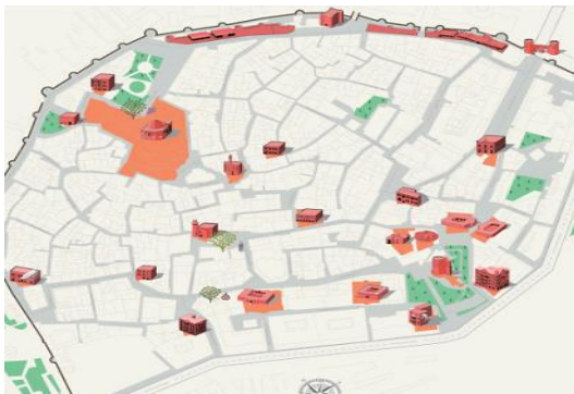
1. İçərişəhər. Bakı