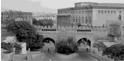
7-8. İçərişəhərin qoşa qala qapısı

Sadalanan nümunələrin şəhərsalma irsinə aid (həm ayrı-ayrı obyektlərə, həm də bütövlükdə şəhərə) praktiki və nəzəri münasibətin özünəməxsus xüsusiyyəti “məzmunca” mənəvi dəyərlərin, həmçinin, nəticədə kompleksin məkan həllinin itirilməsidir.