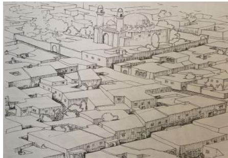
4. Təzəpir məscidi – 1918 il. Bakı