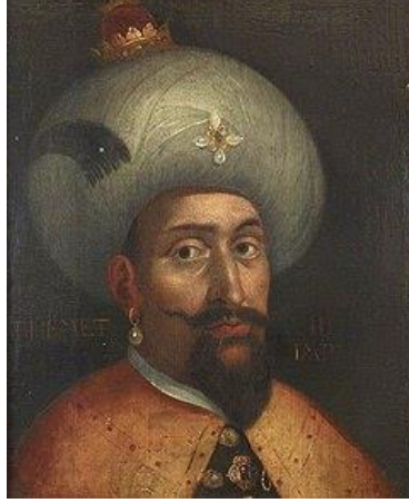
Resim 4: İtalyan ressam Cristofano dell'Altissimo tarafından 16. yüzyılda yapılmış portresi.

III. Mehmed, divan edebiyatındaki mahlasıyla Adnî, 1566 yılında doğdu. 13. Osmanlı padişahı ve 92. İslam halifesidir. III. Murad'ın oğludur. Sancağa giden son, I. Süleyman'dan 30 yıl sonra sefere çıkan ilk padişaktır. Eğri Fatihî unvanı verilmiştir. Döneminde gerçekleşmiş olan Haçova Savaşı, Osmanlı İmparatorluğu'nun Avrupa topraklarında kazandığı son büyük zaferidir. Sancak düzenini kaldırmış ve Celali İsyanları'nı 1595-1603 yılları arasında kanlı şekilde bastırmıştır. 5