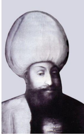
Resim 3: III. Murad'ı tasvir eden bir resim (Galleria degli Uffizi – Floransa)

1546 yılında doğdu. II. Selim'in oğludur. III. Murad, 12. Osmanlı padişahı ve 91. İslam halifesidir. Saltanatı sırasında Osmanlı İmparatorluğu en geniş sınırlara ulaşmasına rağmen, devletteki yozlaşma yine saltanatı sırasında başlamıştır. Saltanatı boyunca sefere gitmemiştir. III. Murad, Osmanlı padişahlarının en bilginlerinden sayılıp, şiir ve hatla uğraşmıştır. Şiirlerinde 'Murâdî' mahlasını kullanmıştır. 4